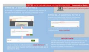
PDF de ayuda con la firma de la solicitud en la Secretaría Virtual

Además de esto, disponen de un video explicativo sobre cómo acceder a la Secretaría Virtual por distintos sistemas de identificación en el siguiente enlace: