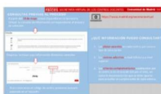
PDF de ayuda con las consultas previas en Secretaría Virtual

Concretamente en esta página se encuentran los siguientes manuales: