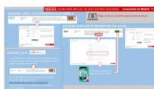
PDF de ayuda con el acceso a la Secretaría Virtual